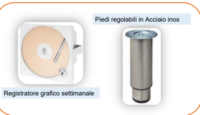
Registratore grafico settimanale