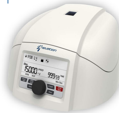
Mod. iFuge M18

Motore ad induzione senza manutenzione in corrente continua (DC); Massima velocità ed accelerazione 15.000 rpm /18.262xg ; Rotore angolo fisso 18x1,5-2ml e adattatori (inclusi nella fornitura) per provette da 0,1/0,2 ml; Display digitale con visualizzazione tempo, RPM e RCF; Sensore di sbilanciamento ; Apertura automatica del coperchio ad ogni fine corsa; Timer da 30 sec a 999 minuti o all'infinito; Tasto per centrifugate veloci ( short spin ); Dimensioni (LxPxH) in mm 262x230x131