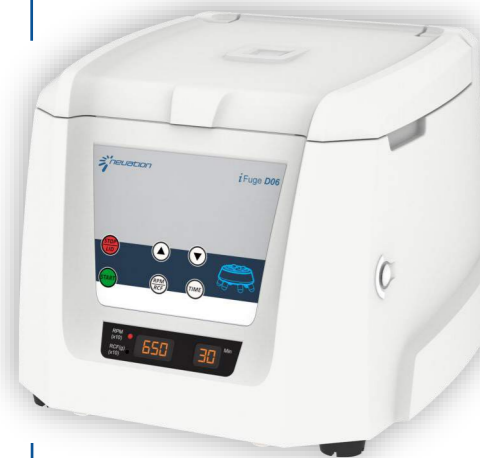
Mod. iFuge D06

Motore ad induzione senza manutenzione in corrente continua (DC); Massima velocità ed accelerazione 6500 rpm/3684xg ; Rotore angolo fisso 6x10/15ml e adattatori (inclusi nella fornitura) per provette da 1,5-2/5-7/9/10 ml; Display digitale con visualizzazione tempo, RPM e RCF; Sensore di sbilanciamento ; Apertura automatica del coperchio ad ogni fine corsa; Timer da 30 sec a 30 minuti o all'infinito; Dimensioni (LxPxH) in mm 260x244x205.