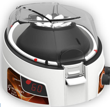
Mod. iFuge BL08 VT

Motore ad induzione senza manutenzione in corrente continua (DC); Massima velocità ed accelerazione 6.000 rpm /2.000xg ; Rotore angolo fisso 8x1,5-2ml con adattatori 0,2/0,5 ml, streep 2x8x0,2 Inclusi nella fornitura; Display digitale con visualizzazione tempo, RPM e RCF; Memoria ultima impostazione (velocità e Tempo); Sensore di sbilanciamento ; Timer da 1 a 25 minuti o all'infinito; Dimensioni (LxPxH) in mm 162x157x115 Mod. iRoll DR16