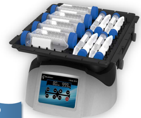
Mod. iShak 3D-3

SHAKER con movimento TRIDIMENSIONALE e Motore ad induzione; Velocità regolabile da 15 a 80 rpm ; Ampiezza di Rotazione 7°; Display digitale con visualizzazione RPM e tempo; Programmazione: memoria di 9 programmi richiamabili; Timer da 1 a 999 minuti o all'infinito; Capacità: fino a 3kg Dimensioni piatto (LxP) mm 307x267 Completo di piattaforma come da foto