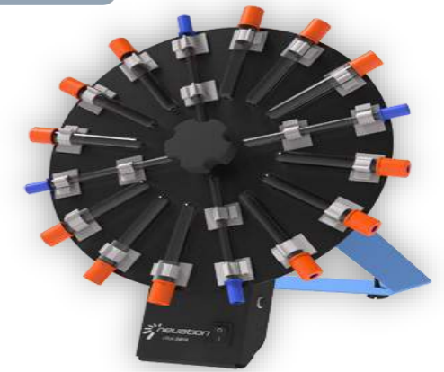
Mod. iRoll DR16

Motore silenzioso e progettato per un lungo utilizzo; Velocità fissa a 30 rpm ; Ruota circolare con angolo fisso a 38°; Capacità 12 tubi per sangue e 4 tubi ESR; Timer all'infinito; Dimensioni (LxPxH) mm 278x252x183